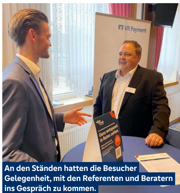
An den Ständen hatten die Besucher Gelegenheit, mit den Referenten und Beratern ins Gespräch zu kommen.

es sei davon auszugehen, dass Deutschland in eine konjunkturelle Rezession schlittere. Die anhaltend hohen Gas- und Strompreise führten zu einer Selbststratierung bei Unternehmen und Verbrauchern, was der Deutschen Wirtschaft merklich den konjunkturellen Schwung nähme. Dennoch konnte Völke einen positiven Ausblick geben: Auf jede Krise folge auch ein Aufschwung, sowohl realwirtschaftlich als auch an den Börsen. Dieser Aufschwung sollte spätestens bei einer merklichen Verbesserung der Krisenherde eintreten. Hierzu gehörten mögliche Lockerungen der Corona-Maßnahmen oder Konjunkturstimuli in China bzw. echte Friedensverhandlungen im Ukraine-Krieg oder ein Ausbleiben der gefürchteten Notenbank-induzierten Rezession in den USA („Hard Landing“). Insbesondere die aktuell sehr trübe Lage in China biete eine wunderbar niedrige Ausgangslage für positive Überraschungen jeglicher Art.